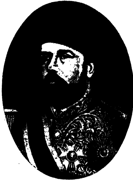
الحديو اسماعيل مجدد الوقائع المصرية

سريعة نقلتهم من جيل إلى جيل ، فخرى به وقد تجدد كل شيء في عصره واثارت الحياة المصرية على نفسها أن تمس هذه الثورة جريدته الرسمية وأن يناطها حظ من التقدم والارتقاء ، وإن كان حظها من نشاطه ورعايته جاء متأخرا بعض الشيء .